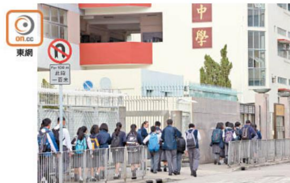
中一自行分配學位申請表已經派發。

加額，因此令該區減少了21個學額。東區有兩所英中減少10個學額，亦有一所加了10個學額，在此消彼長下，該區減少了10個學額。另外，有11個區的英中學額不變，當中包括中西區、灣仔區、九龍城區及屯門區等。